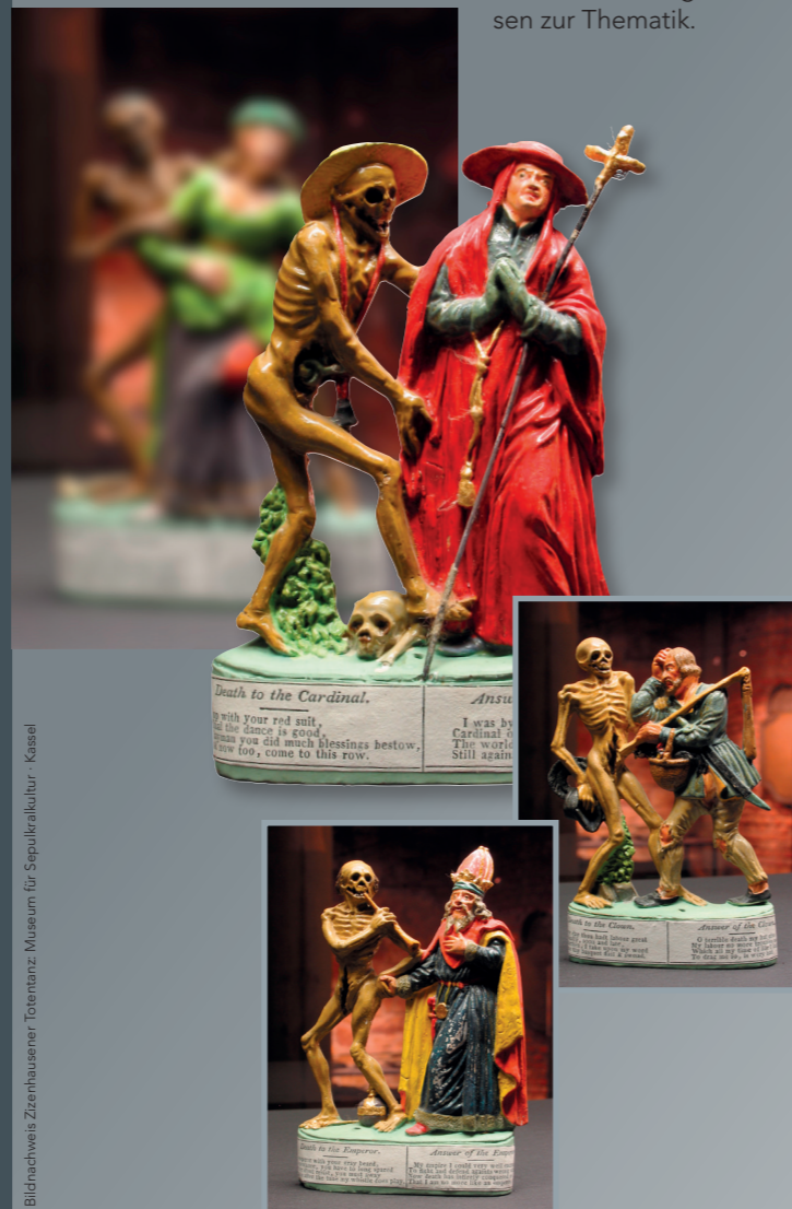
Bildnachweis Zizenhausener Totentanz: Museum für Sepulkralkultur - Kassel

Der Zizenhausener Totentanz aus der Sammlung Steuer umfasst 41 Terrakottafiguren, die in das frühe 19. Jahrhundert datiert werden. Die als Serie produzierte Figurenreihe wurde von Anton Sohn in Zizenhausen bei Stockach erschaffen und basiert sehr wahrscheinlich auf Wiedergaben des 1805 zerstörten Basler Totentanzes, einer der frühesten und bekanntesten Totentanzdarstellungen. Ergänzend zu den Figurenpaaren befinden sich an deren Sockel Schriftzüge mit Versen zur Thematik.